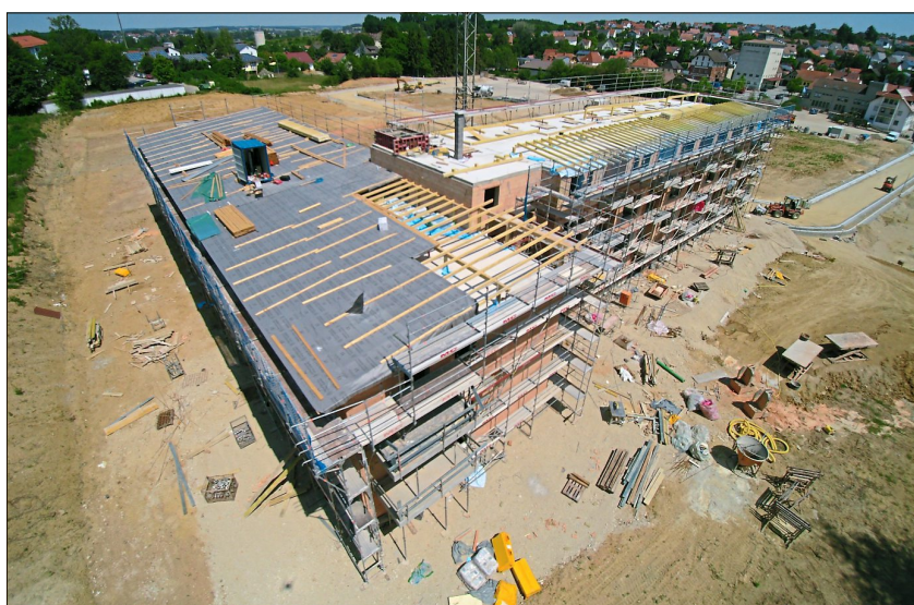
Der Rohbau des Gebäudes auf dem Gelände der „Alten Ziegelei“ ist mit seinen 37 Wohnungen nun fertiggestellt worden.

wahren lassen, sodass der Pflegedienst unkompliziert in die Wohnungen gelangen kann. Wenn eine Unterstützung gewünscht wird, kann ein Betreuungsangebot bei der Ambulanten Kranken- und Alten-